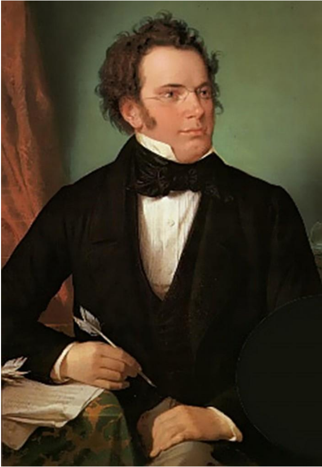
Franz Schubert ritratto da Wilhelm Rieder