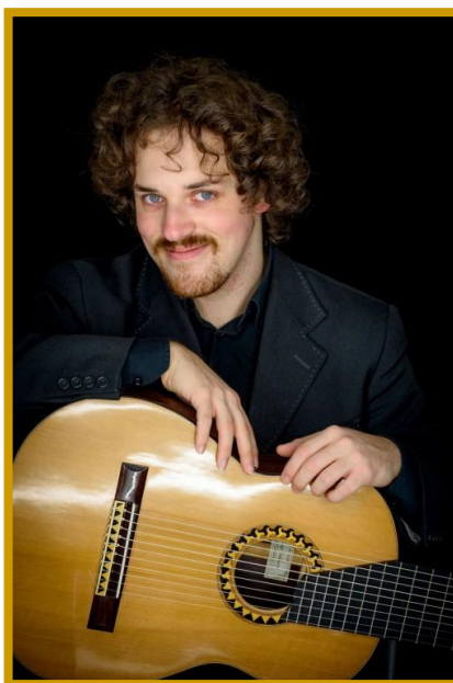
Chitarra LEONARDO DE MARCHI