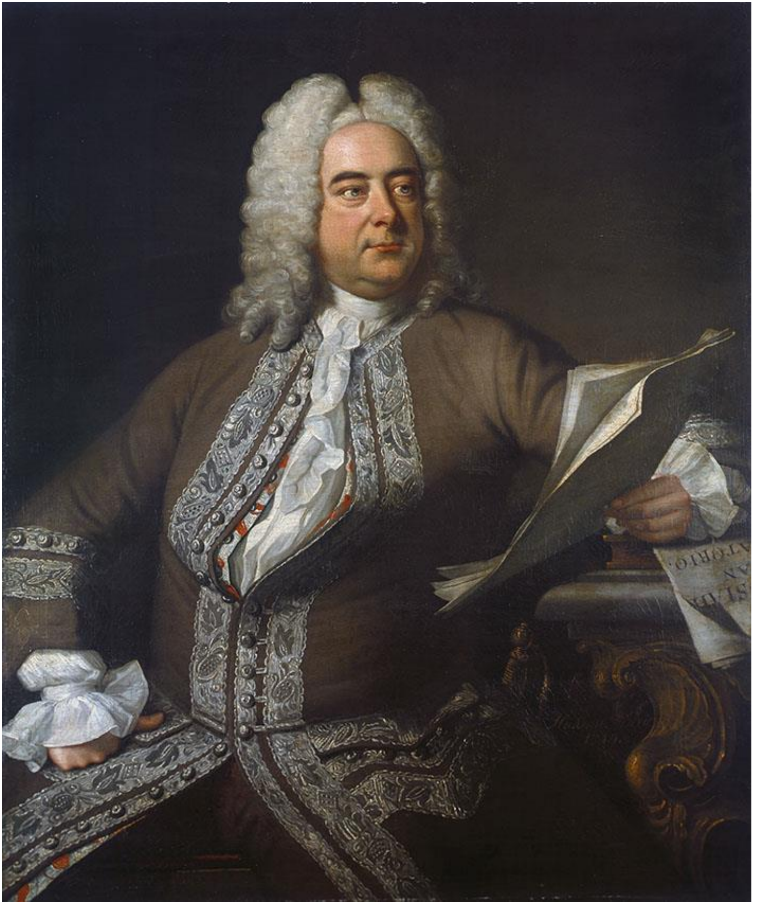
Ritratto di G.F. Händel, di Thomas Hudson (1741)