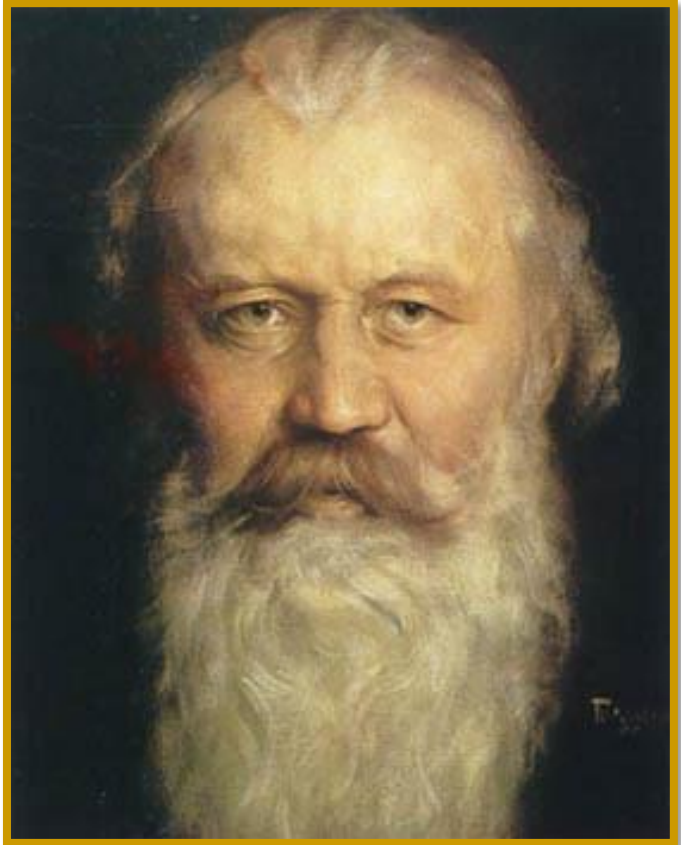
Ritratto di Johannes Brahms