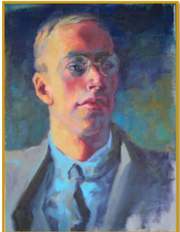
Ritratto di Sergei Prokofiev