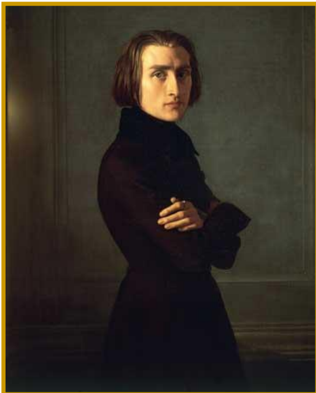
Ritratto di Franz Liszt