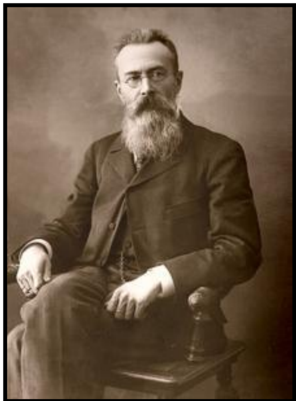
Nikolaj Rimskij-Korsakov, fotografia, 1897.